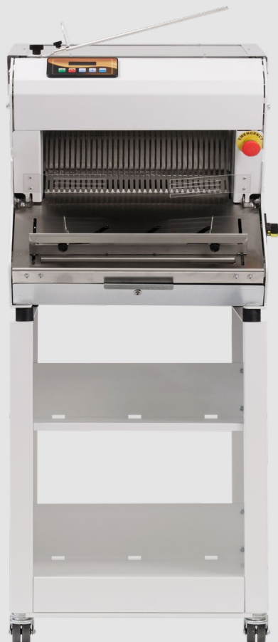
mod. S4AB | S5AB