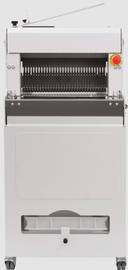
mod. S4AV | S5AV