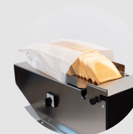
OPTIONAL aprisacchetto bag blower открытый мешок

Tipo di lama Blade type: тип лезвия: standard BL 0.5 strong BL 0.7 teflon TFB