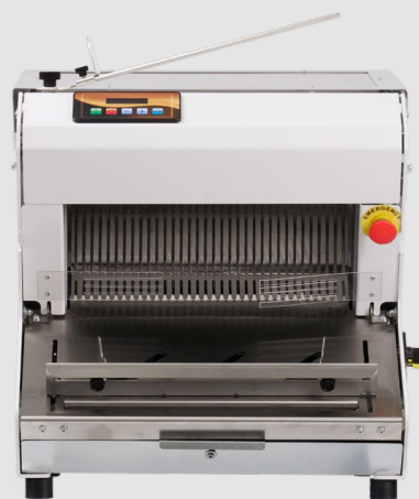
mod. S4A | S5A

taglierine automatiche / automatic slicers